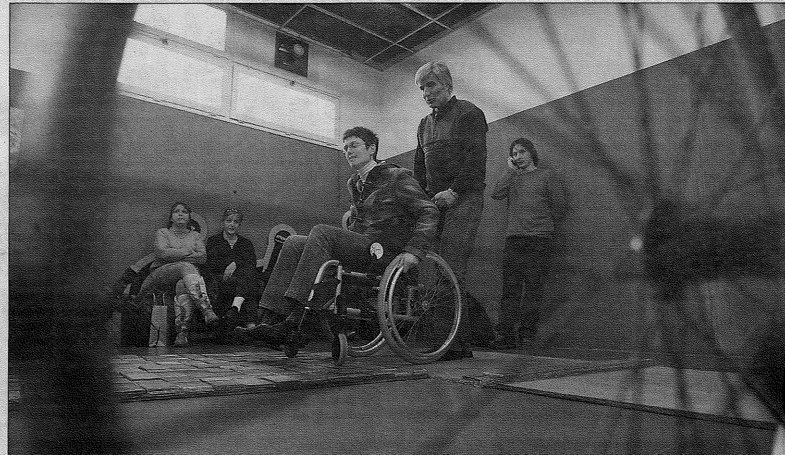
Installée, hier après-midi, salle Leyrit, cette piste de bois concentre toutes les difficultés rencontrées au quotidien par les personnes en fauteuil roulant.

Le premier obstacle passé, une porte à pousser d'une main tout en immobilisant de l'autre le fauteuil roulant, la voilà qui bute sur