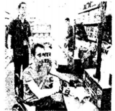
Au Monop' place Gambetta, une sonnette (mal indiquée) a été placée à l'entrée du magasin et les caisses sont accessibles aux handicapés. En revanche, la sortie est dangereuse.